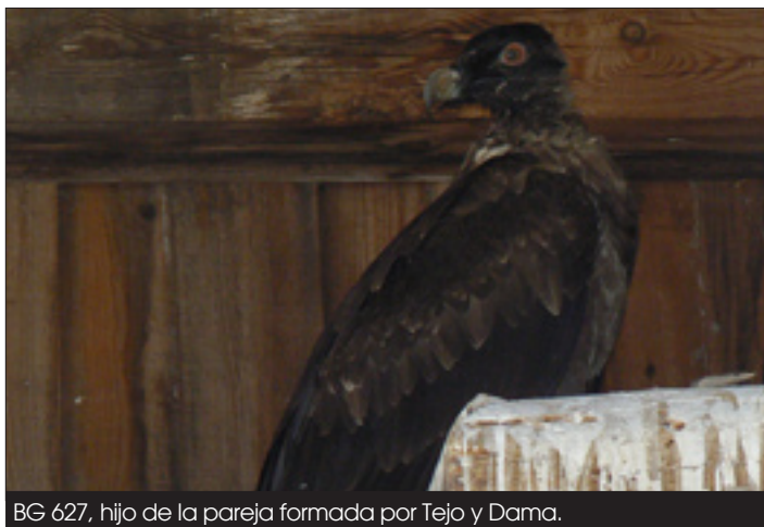
BG 627, hijo de la pareja formada por Tejo y Dama.

chos ya han muerto y de los que aún viven, muy pocos son capaces de seguir reproduciéndose. Respecto al CCQ, los dos primeros ejemplares de la red de cría llegados a Andalucía fueron Tus y Gualay, dos machos, en diciembre de 1996. La primera pareja reproductora, formada por Joseph y Zumeta, llegó al CCQ en octubre de 1998, aunque no fue hasta 2002 cuando nació su primer pollo. Fue el primer quebrantahuesos nacido en cautividad en Andalucía y, al igual que Tus, permanece en el centro de cría andaluz. En este tiempo, Tus, emparejado con Keno, ya ha tenido dos pollos. Gualay, Joseph y Zumeta, por su parte, fueron posteriormente trasladados a Vallcaient donde continúan dentro del programa de cría en cautividad. ■