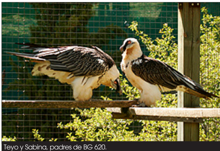
Teyo y Sabina, padres de BG 620.