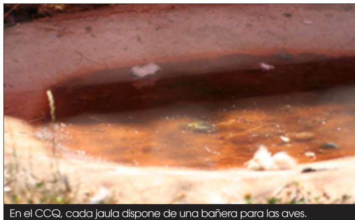
En el CCQ, cada jaula dispone de una bañera para las aves.

En el CCQ, los ejemplares de la especie no tienen la opción de buscar aguas ferruginosas para poder realizar sus baños, por lo que los cuidadores, les preparan cuencos con baños de barro que las aves utilizan con bastante frecuencia.